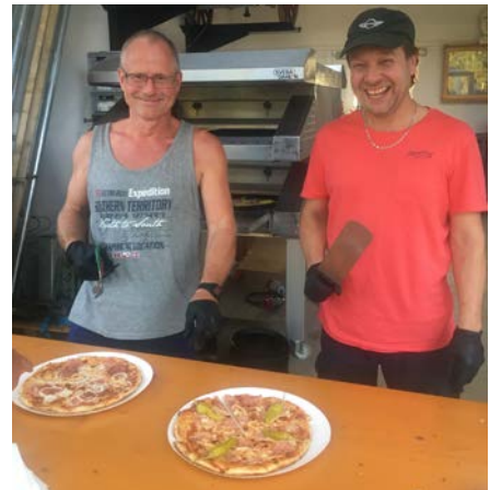
(Bilder & Text: Christina Dreher)